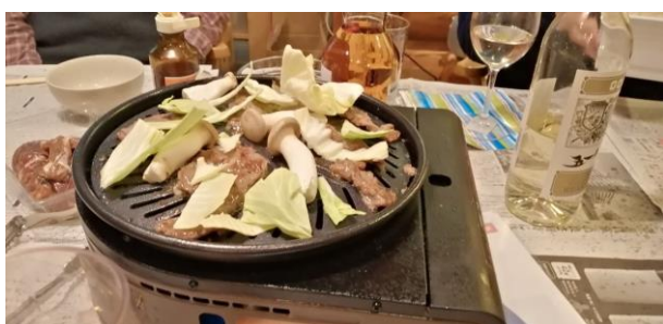
ジンギスカン。とても美味しかったです。